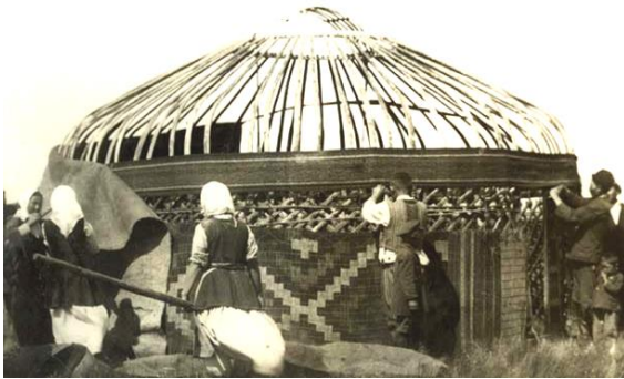
Сурет 1. Дәстүрлі киіз үйдің алдыңғы көрінісі

[Дереккөз: Сарыарқаның қолданбалы колөнері, 2010 жыл]. [Дереккөз: Сарыарқаның қолданбалы колөнері, 2010 жыл].