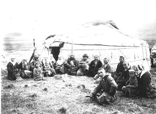
Сурет 5. XX ғасыр. Киіз үйдің жанындағы көрініс

[Дереккөз: Сарыарқаның қолданбалы қолөнері, 2010 жыл]. [Дереккөз: Сарыарқаның қолданбалы қолөнері, 2010 жыл].